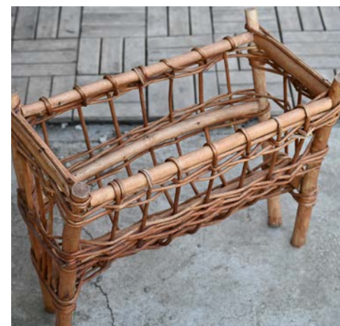
hore: produkty lokálnej výroby v regióne Gemer vľavo: drevorezbár, obec Bretka