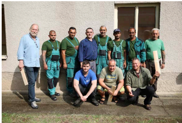
Nórski partneri počas spoločnej práce s tímom Obnovme Gemer.