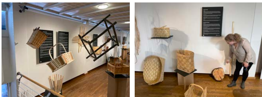
Výstava košíkárstva, Nórsky inštitút remesiel.